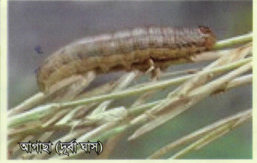
বিভিন্ন ফসলে ফল আর্মিওয়ার্ম এর আক্রমণ