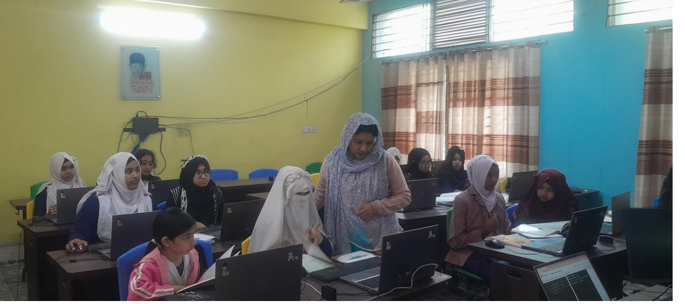
চিত্র: (ক) সহকারী প্রোগ্রামার ল্যাব কক্ষে প্রশিক্ষণ কার্যক্রম পরিদর্শন করেন