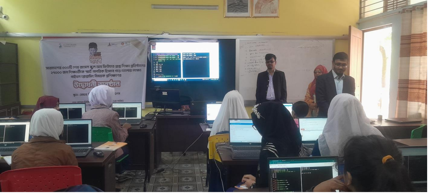
চিত্র: (খ) ল্যাব কক্ষে ১ম ব্যাচের পাইথন প্রোগ্রামিং প্রশিক্ষণ কার্যক্রম চলমান