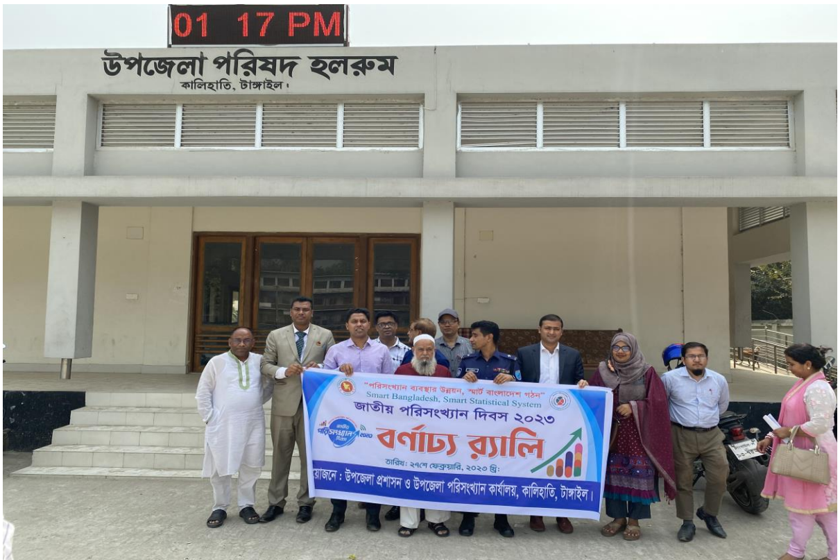
চিত্র-০৩- জাতীয় পরিসংখ্যান দিবসের খন্ডচিত্র ।