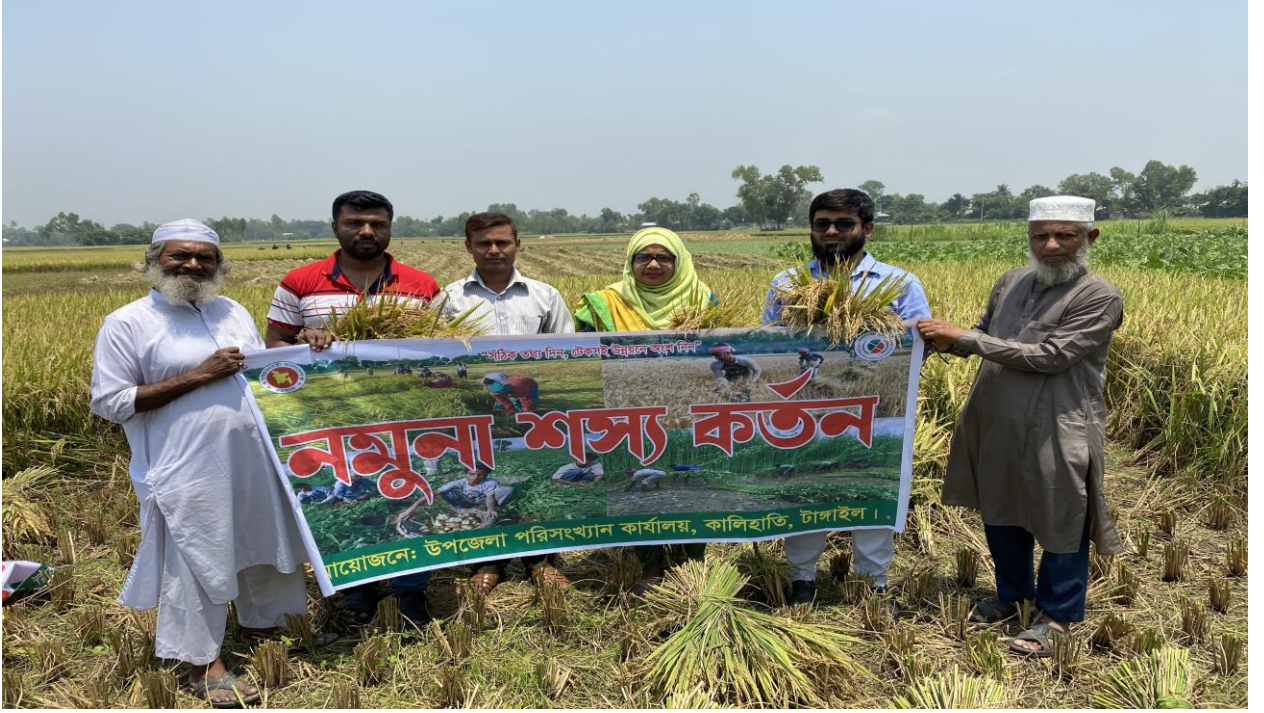
চিত্র-০১,- উপজেলা কৃষি অফিস, কালিহাতি এবং উপজেলা পরিসংখ্যান অফিস, কালিহাতির যৌথ উদ্যোগে ধানের নমুনা শস্য কর্তন এর খন্ডচিত্র।