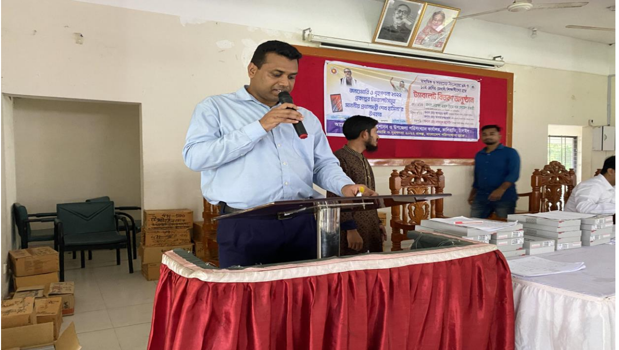
চিত্র-০২-মাননীয় প্রধানমন্ত্রীর উপহার হিসেবে জনশুমারি ও গৃহগণনা ২০২২ এ ব্যবহৃত ট্যাবলেটসমূহ মেখাবী শিক্ষার্থীদের মাঝে বিতরণের খন্ডচিত্র।