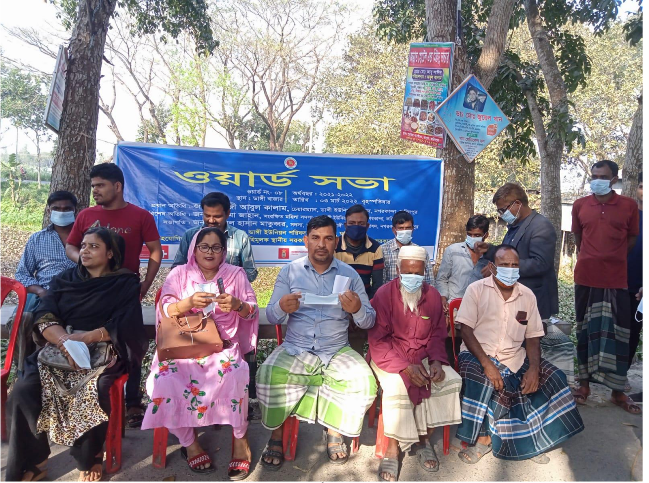
৩নং ওয়ার্ড সভার ছবি