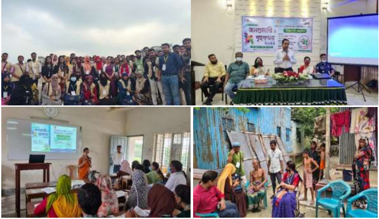
জনশুমারি ও গৃহগণনা ২০২২ এর কিছু খন্ড চিত্র