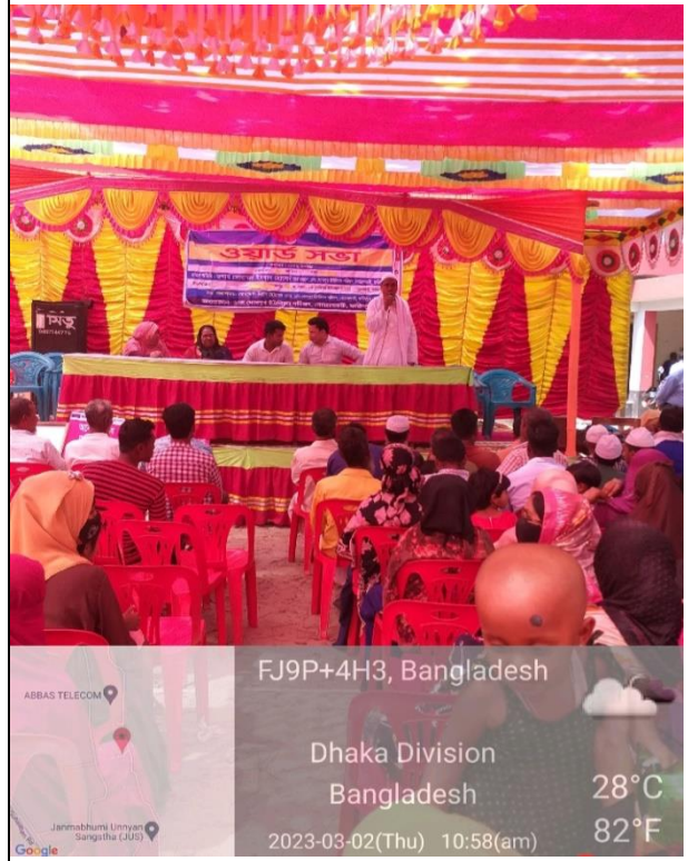
FJ9P+4H3, Bangladesh Dhaka Division Bangladesh 28°C 82°F 2023-03-02(Thu) 10:58(am)