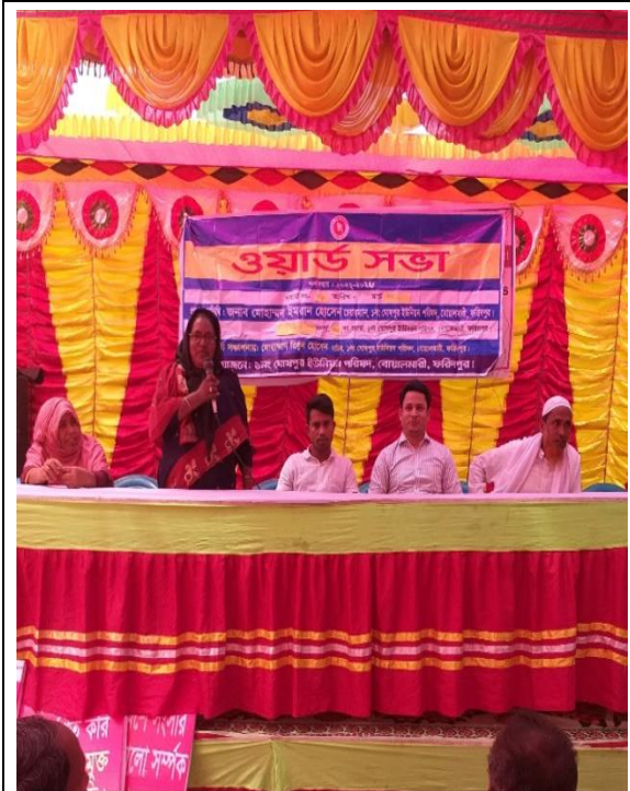
FJ9P+4H3, Bangladesh Dhaka Division Bangladesh 28°C 82°F 2023-03-02(Thu) 10:56(am)