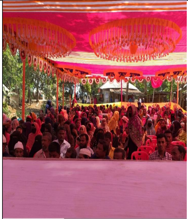
FJ9P+4H3, Bangladesh Dhaka Division Bangladesh 28°C 82°F 2023-03-02(Thu) 11:01(am)