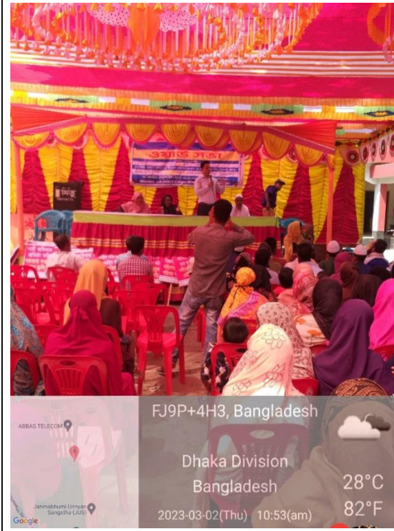
FJ9P+4H3, Bangladesh Dhaka Division Bangladesh 28°C 82°F 2023-03-02(Thu) 10:53(am)

(জিপিএস লোকেশনসহ ক্রীম প্রস্তুতকারীর ছবি- ৩টি, ব্যানারসহ উপস্থিত অতিথিদের ছবি-১টি) = মোট ৪টি ছবি