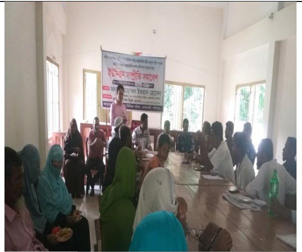
Sajal's Country House FJ8P+PGF, Bangladesh Dhaka Division Bangladesh 34°C 93°F 2023-08-30(Wed) 04:36(pm)