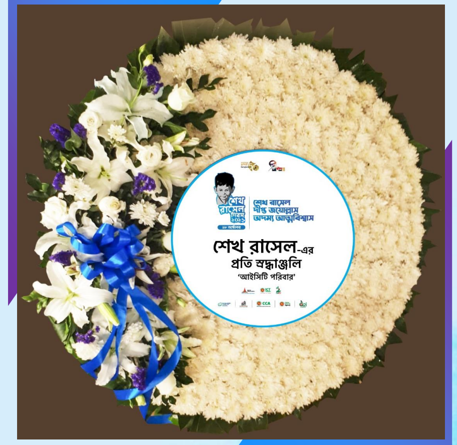
শেখ রাসেল-এর মুর্যাল বা প্রতিকৃতি